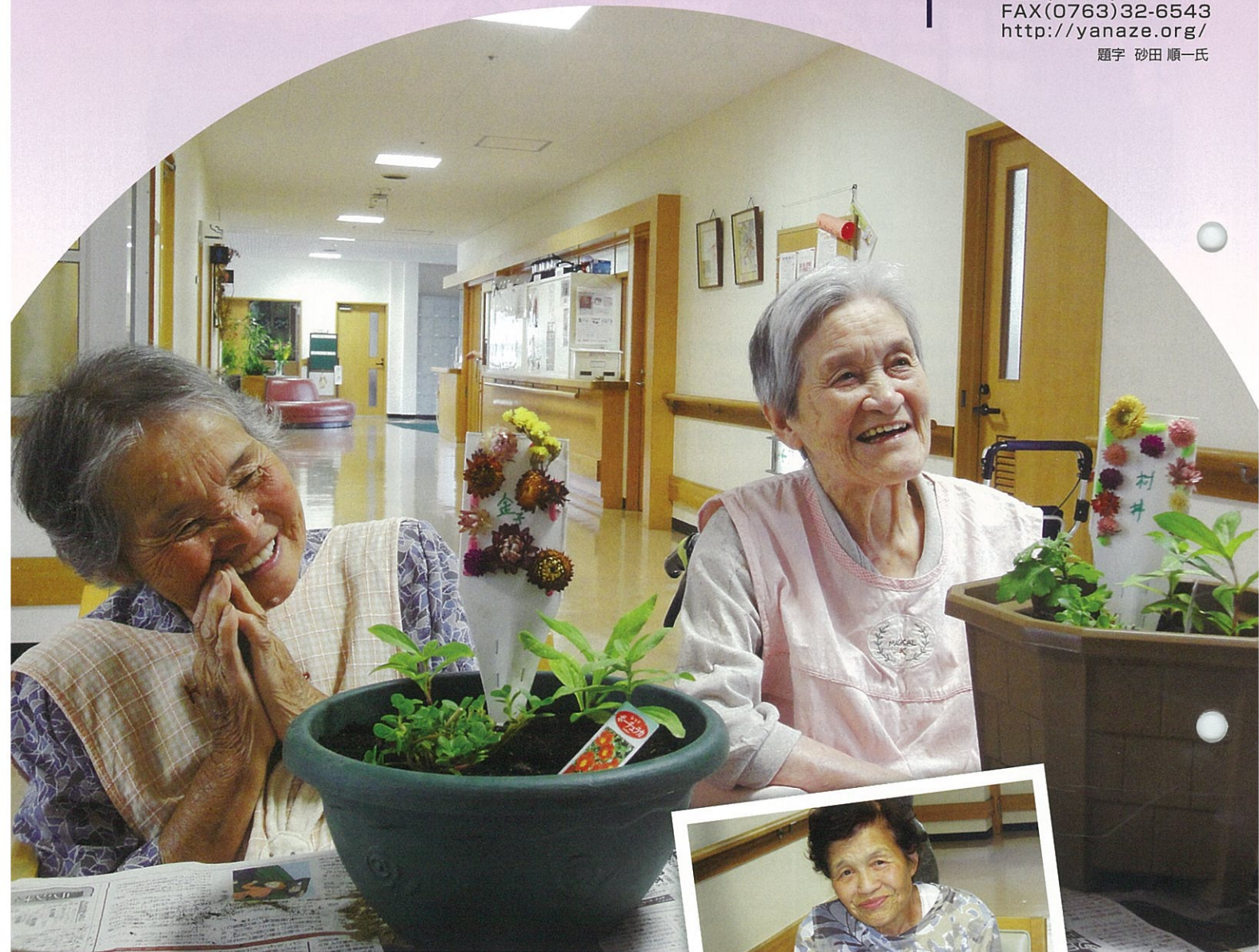
やなせデイサービス 園芸活動にて