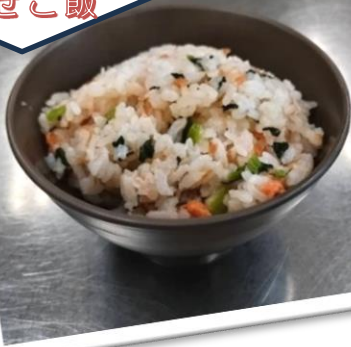
鮭と小松菜の 混ぜご飯